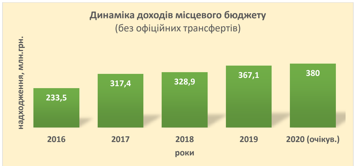
Рис. 3. Динаміка доходів бюджету Слобожанської ОТГ, млн.грн.

В розвиток громади вагомий внесок вносять юридичні особи та фізичні особи-підприємці, як сплачують податки до місцевого бюджету, зокрема, податок на доходи фізичних осіб, акцизний податок, місцеві податки і збори.