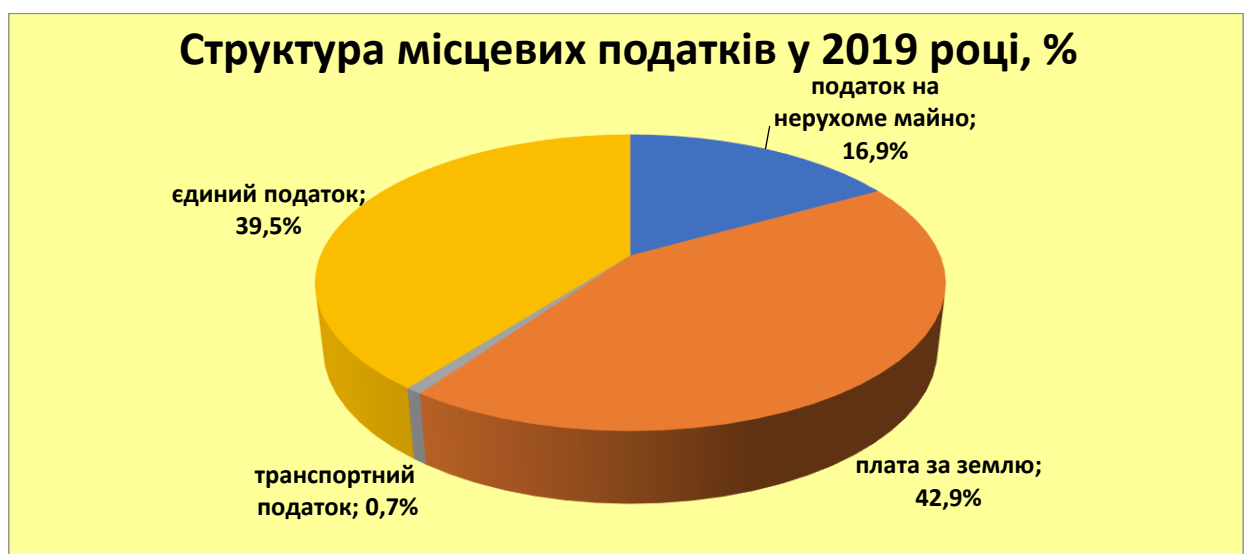
Рис. 4. Структура місцевих податків і зборів.

Основні джерела податкових надходжень протягом 2016-2020 років майже не змінні. Більше половини – це надходження ПДФО (65%), акцизний податок – 15%, місцеві податки і збори – 19,0% (рис. 4) і т.д.